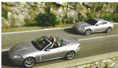
Momentan die stärksten Raubkatzen: XKR Cabrio und Coupé mit 416 PS. Der Spurt dauert nur 5,2 Sekunden

In den XKR-Modellen sorgt ein Kompressor für mehr Leistung