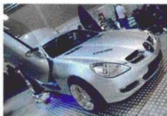
Alles über die Messe in Klagenfurt finden Sie unter www.austrian-tuning-show.at

Im Bericht zur Kärntner Tuningmesse, der Austrian Tuning Show vom 11. bis 13. Mai, wuselt es vor Fehlern: AUTO BILD Österreich gab den Zeitabstand zum Wörtherseetreffen der Golf-Fans in Heft 45/05 irrtümlich mit zehn Tagen an. Das VW-Spektakel findet aber ab 16. Mai statt. Und nach der Party am Samstag geht die Messe sonntags weiter.